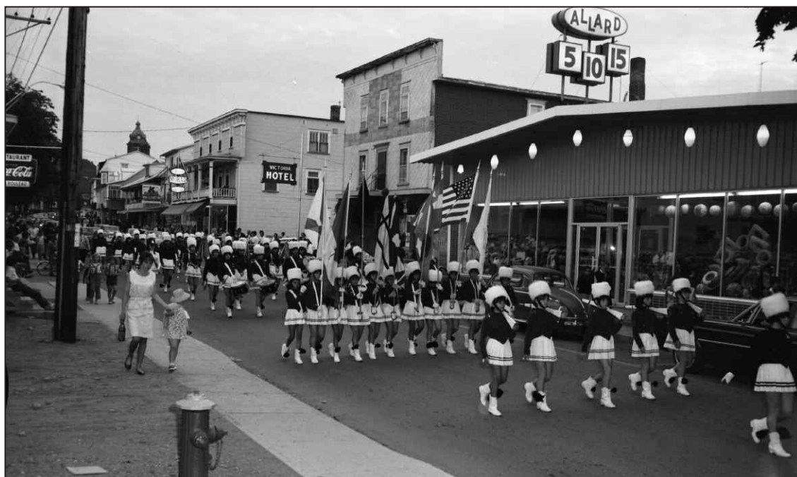
Le rassemblement de 1966 avait même donné lieu à une parade dans les rues de la ville de La Pocatière avec la fanfare des majorettes de Rivière-du-Loup en tête.