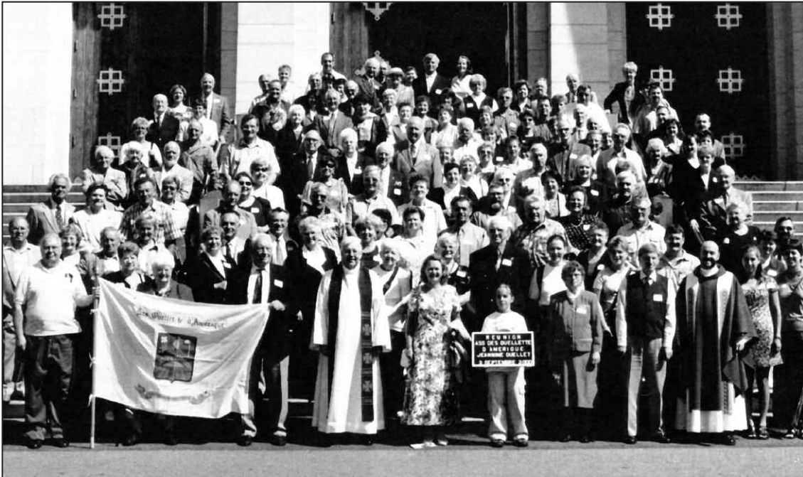
Le rassemblement ayant eu lieu au Cap-de-la-Madeleine en septembre 2000.