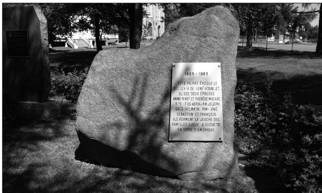
Monument et plaque à l'entrée du cimetière de Rivière-Ouelle depuis 1997