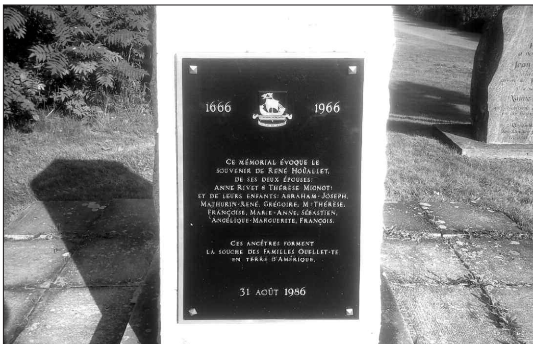
Plaque apposée sur le monument au sanctuaire de Notre-Dame de Fatima à Sainte-Anne-de-la-Pocatière