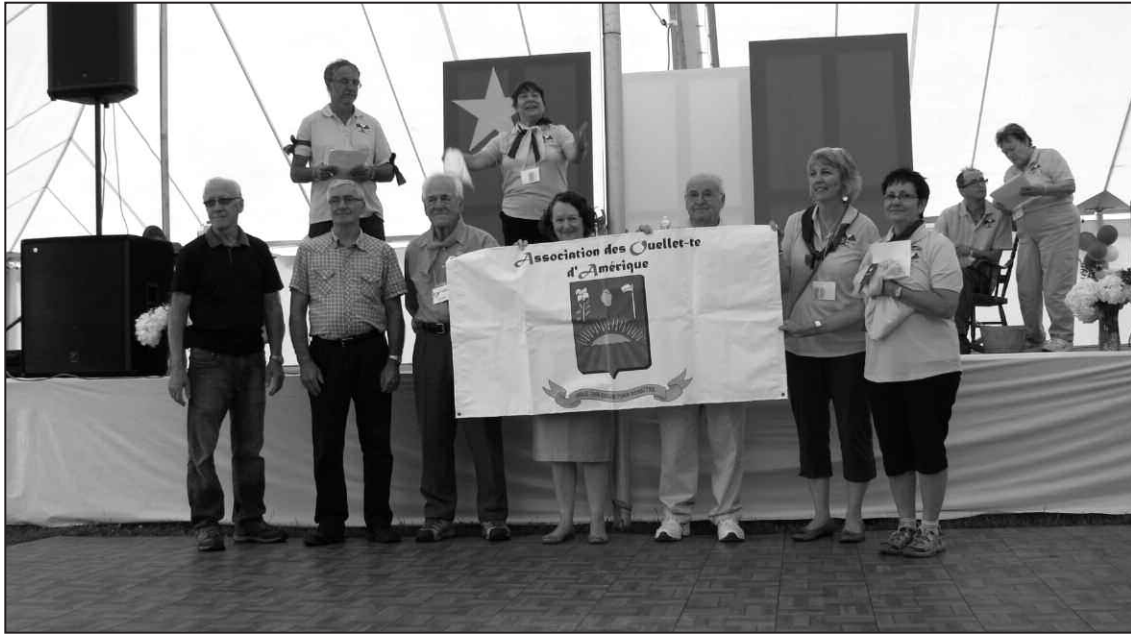
Ouverture du rassemblement dans le cadre du Congrès mondial acadien en août 2016 à Saint-Hilaire, Nouveau-Brunswick.