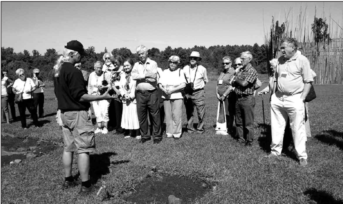
Le rassemblement à Saint-Anicet en septembre 2010. Visite au site archéologique Drolers/ Tsiionhiakwatha, ancien village iroquoien.