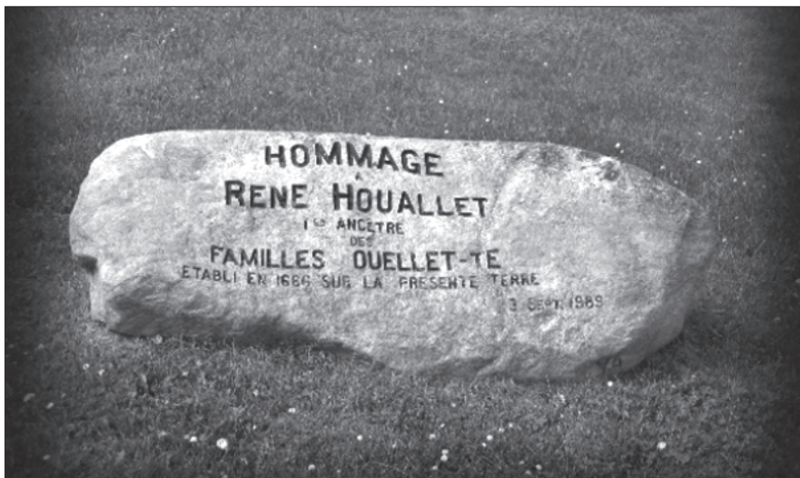
Pierre sur la terre de René Hoûallet à Sainte-Famille, Île d'Orléans.