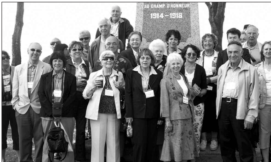
Le rassemblement à Rimouski en 1989.